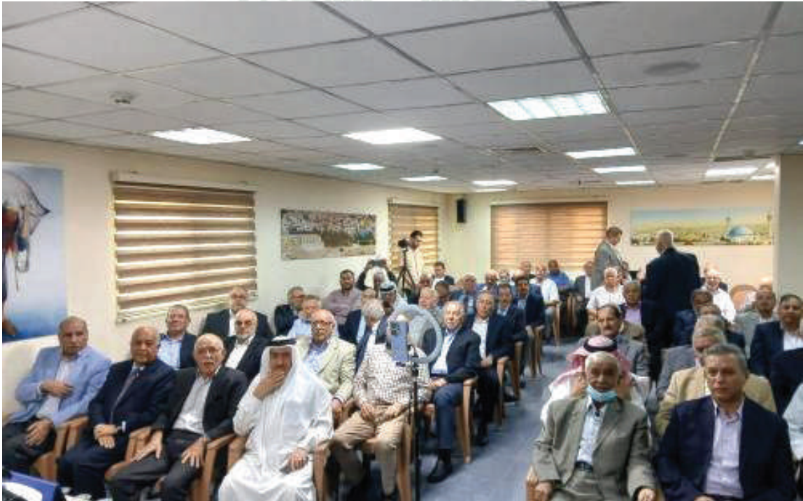
من فعاليات المنتدى

القاعدة الرابعة: لا يأتي نصر الله حتى يستفرغ الناس كل ما بوسعهم من فكر وجهد ومال وقوة وشوكة.. فإذا أعدوا المستطاع من أنفسهم وفي واقعهم أتم الله لهم ما ليس في طوقهم، وجاء نصره في لحظة اليأس القصوى: {حَتَّى إِذَا اسْتَيْأَسَ الرُّسُلُ وَظَنُّوا أَنَّهُمْ قَدْ كُذِّبُوا جَاءَهُمْ نَصْرًا فَجَازَى مَنْ نَسَاءَ وَلَا يُرَدُّ بِأَسْأَا عَنِ الْقَوْمِ الْمُجْرِمِينَ} [يوسف: ١١٠]، وبأس الله شديد مهما كثر عدد المجرمين في الأرض، وسننه ماضية مهما تعددت أقنعة الذين لا يعلمون.. فمن تحت أقنعة العار تفوح ريح الخيانة والنذالة والهوان، وربك عزيز ذو انتقام.